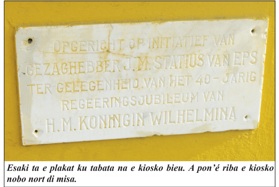
Esaki ta e plakát ku tabata na e kiosko bieu. A pon'é riba e kiosko nobo nort di misa.

okashon gruponan ku tabata trese e tipo di muzik aki tabata bini for di Kòrsou pa aktua na Boneiru. E presentashonnan aki tabata algu úniko i hopi hende sa akudí na Playa, dilanti e ki- osko di Gezaghheber van Leeu- wen, pa skucha e bunita muzik ku e gruponan aki tabata deleitá orea di hende kuné.